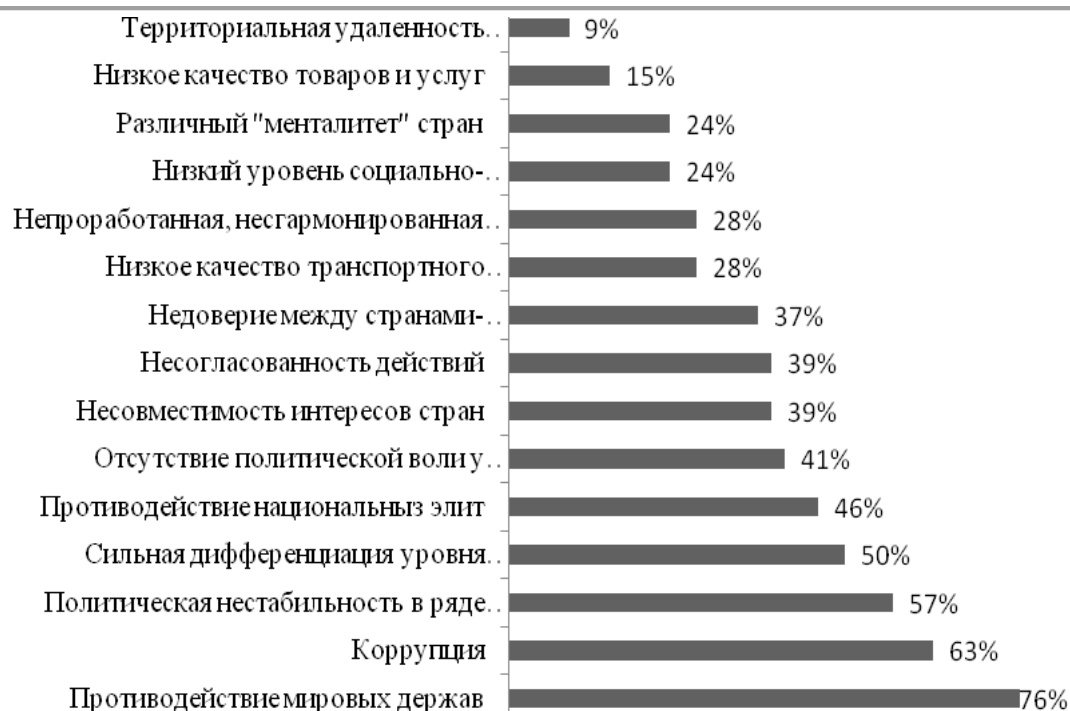
Рисунок 1. Распределение ответов на вопрос: «Как вы считаете, в чем заключаются основные риски евразийской интеграции в ближайшие годы?», в % от всех опрошенных (множественный выбор)

На первом месте среди возможных рисков стоит «противостояние мировых держав» (76%). 63% экспертов считают коррупцию возможным риском евразийской интеграции в ближайшие годы. Третье место (57%) занимает «политическая нестабильность в ряде регионов». Половина экспертов считает, что угрозу ЕАЭС в ближайшем будущем может нанести сильная дифференциация уровня жизни. Еще одним риском выступает «противостояние национальных элит». Оно было отмечено 46% экспертов. Отсутствие политической воли у некоторых стран-участников так же рассматривается в качестве возможной угрозы, и с этим согласны 41% респондентов. Несовместимость интересов стран и несогласованность их действий набрали по 39%. Значительное количество экспертов (37%) рассматривают недоверие между странами-участниками как основной риск интеграции в ближайшие годы. Помимо этого были выделены такие риски как «низкое качество транспортного сообщения» (28%); «непроработанная, несгармонизированная нормативно-правовая база» (28%); по 24% получили варианты – различный менталитет стран и низкий уровень социально-экономического развития участников и потенциальных участников ЕАЭС.