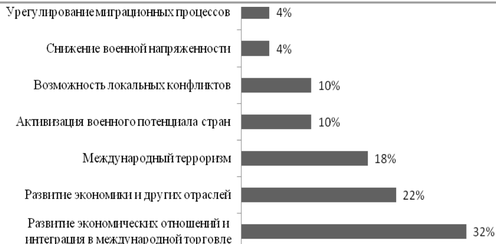
Рисунок - 3. «Как вы считаете, в чем заключаются основные драйверы развития евразийской интеграции в ближайшие годы?» (открытый вопрос).

В настоящее время страны ЕАЭС ведут поиск эффективной модели интеграции. Ее успех во многом зависит от действий заинтересованных стран в экономическом и политическом объединении. С данным фактом согласны 54% экспертов, отнесших к драйверам развития интеграции – развитие экономики, экономических отношений и интеграцию в международной торговле.