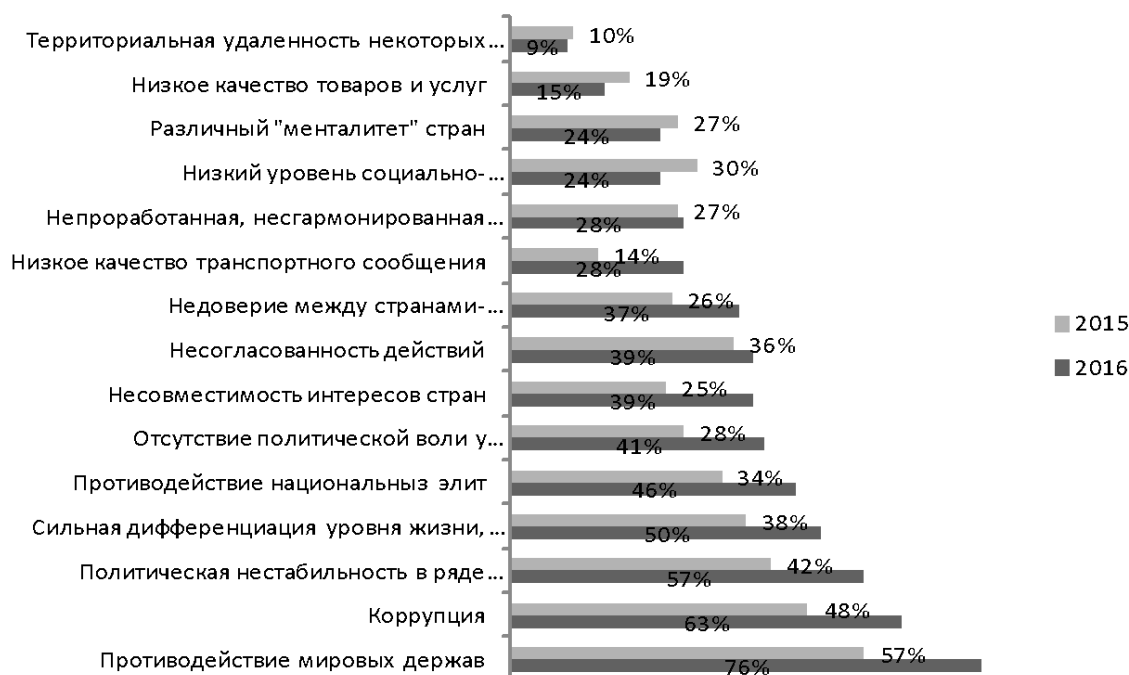
Рисунок 2. Распределение ответов на вопрос: «Как Вы считаете, в чем заключаются основные риски евразийской интеграции в ближайшие годы?», в % от всех опрошенных за 2015-2016 гг.

(+15%); третье место занимает проблема политической нестабильности регионов, увеличившая свои позиции так же на 15% (См. рис. 2).